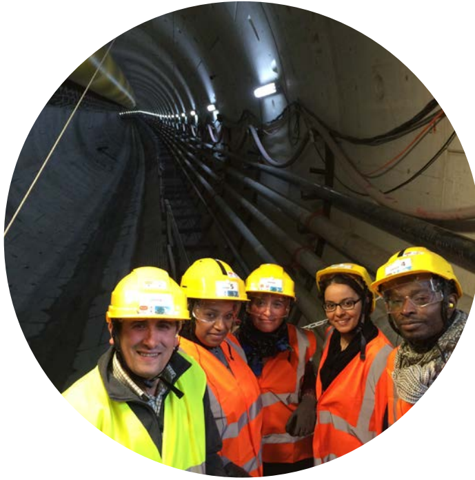
Visite du tunnelier de la ligne 14 par l'équipe Humando Insertion (agence Humando Insertion de Pantin).