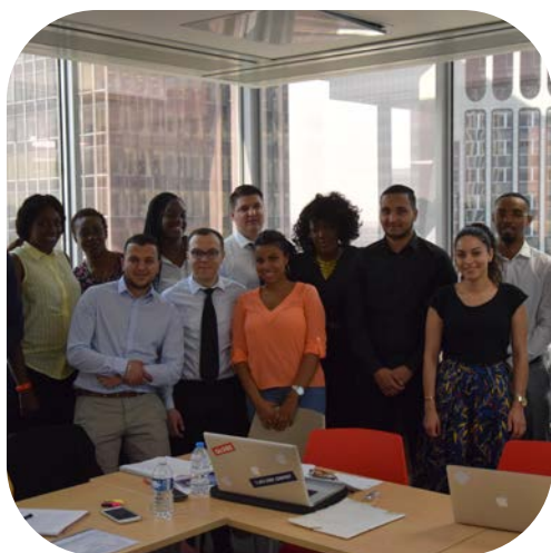
Sessions d'alternants issus des QPV formés au métier de conseiller clientèle pour/au sein d'un grand groupe bancaires

Le focus met en exergue une action à fort impact social déployée récemment par le cabinet de conseil en diversité, Humando Pluriels, filiale de The Adecco Group.