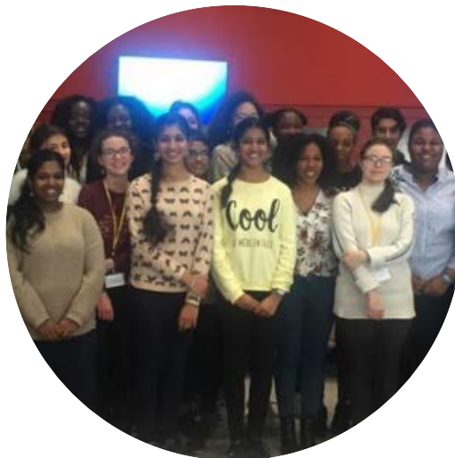
Accueil de stagiaires de 3 ème avec l'association Tous en Stage