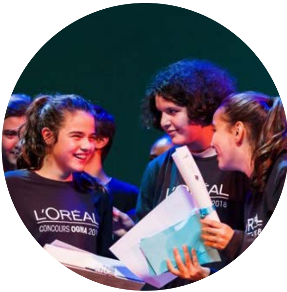
Concours d'éloquence organisé à Aulnay-sous-Bois dans le cadre du programme OGMA