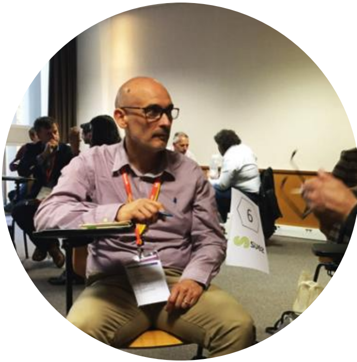
Participation de SUEZ à l'étape marseillaise de la Tournée des Achats Impactants le 10 octobre 2018 au Salon des Entrepreneurs de Marseille.