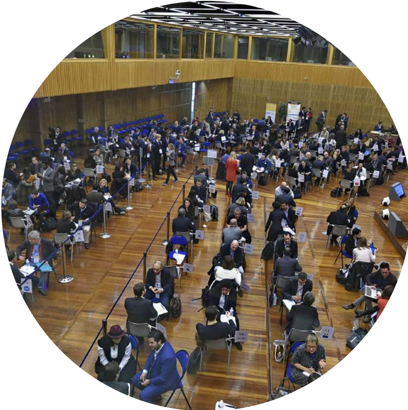
Webforce3 proposait ses formations à fort impact social à la Tournée des Achats Impactants à Bercy le 13 avril 2018