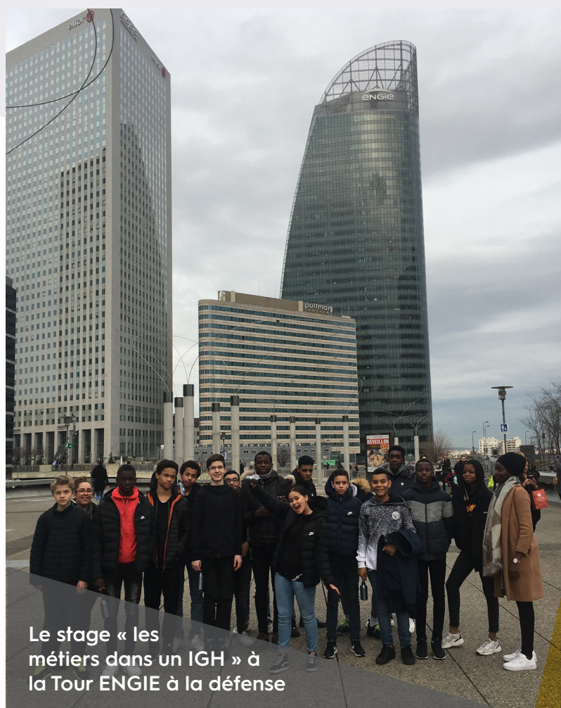
Le stage « les métiers dans un IGH » à la Tour ENGIE à la défense