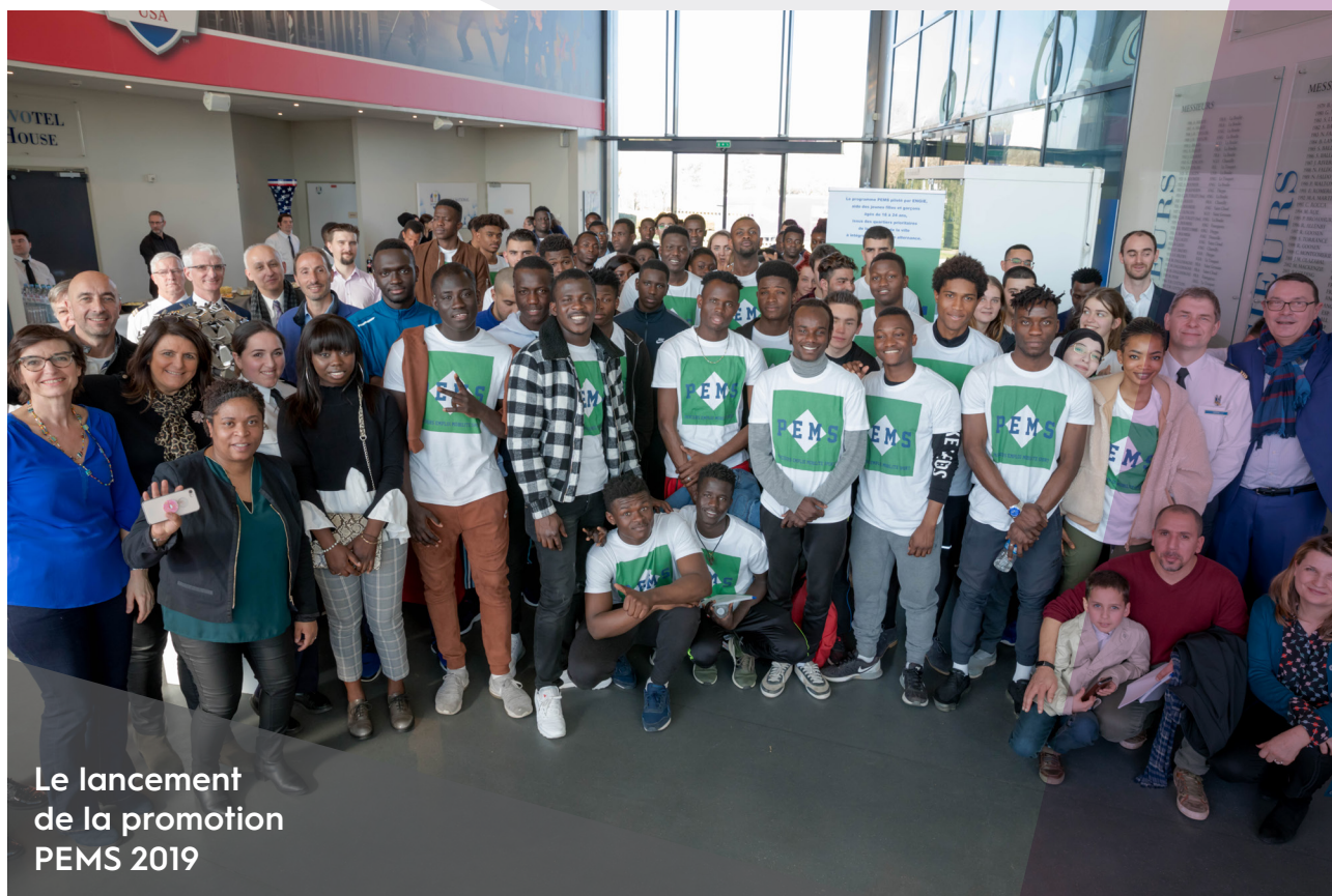
Le lancement de la promotion PEMS 2019

Responsable Equipe Exploitation, ENGIE Solutions