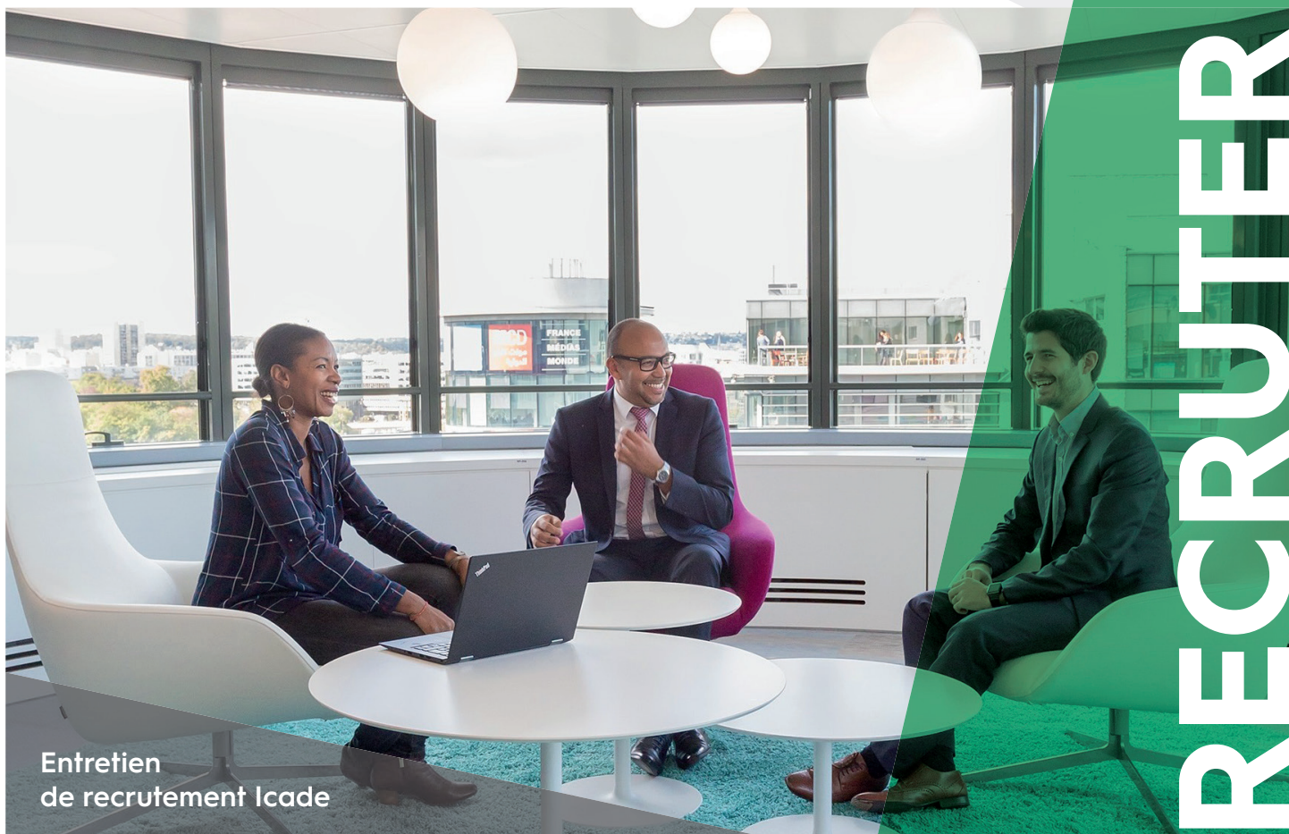
Entretien de recrutement Icade