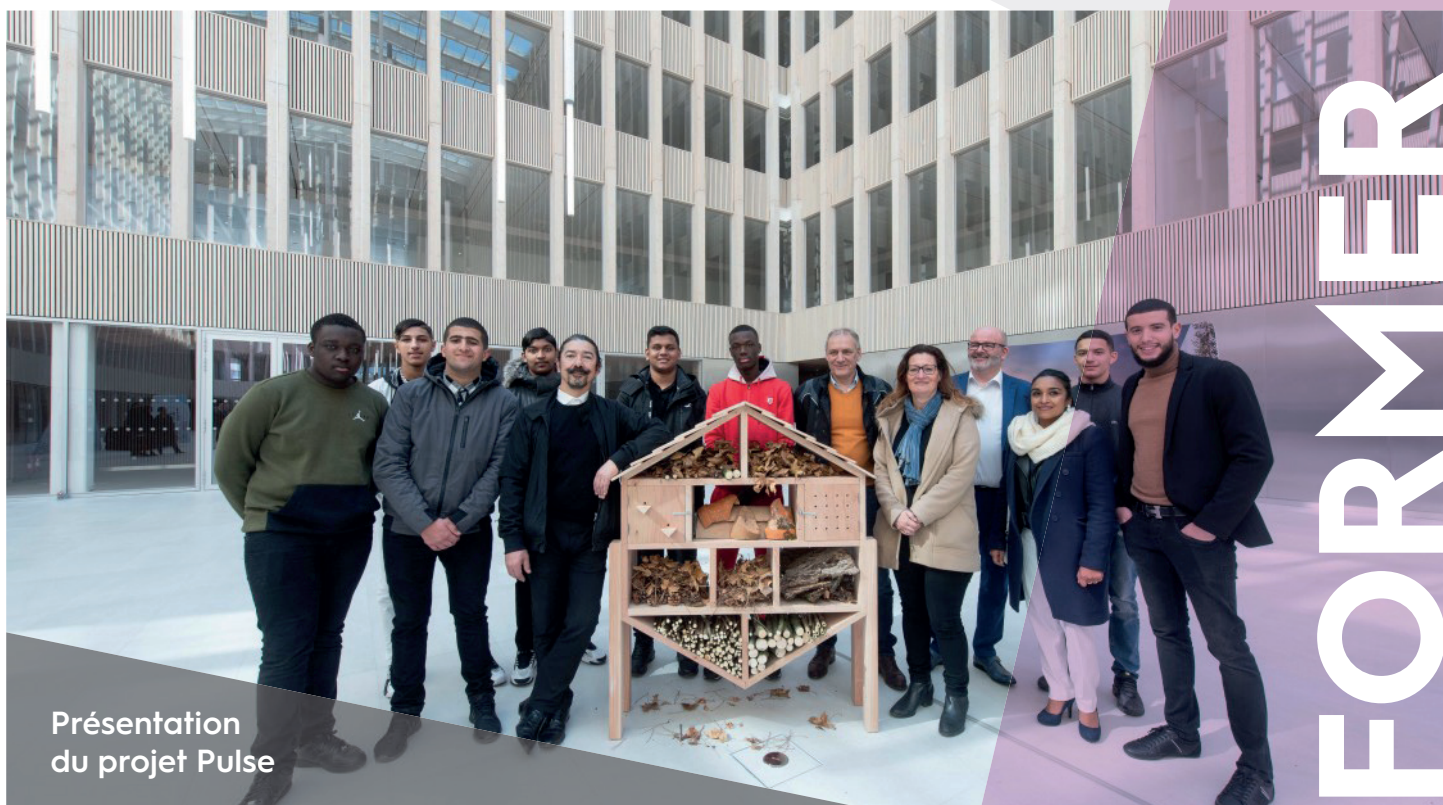
Présentation du projet Pulse

Chargé de Programme pour le bâtiment Pulse