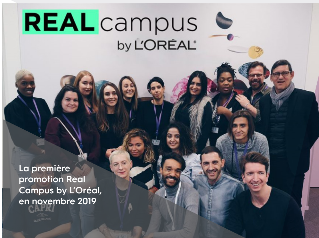
La première promotion Real Campus by L'Oréal, en novembre 2019

Directrice Générale de la Division des Produits Professionnels