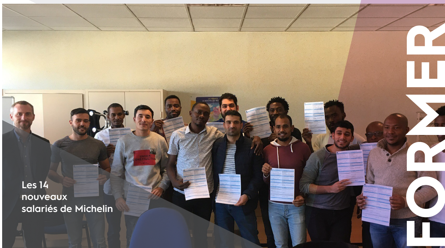
Les 14 nouveaux salariés de Michelin

Chargée de l'attractivité et de l'intégration