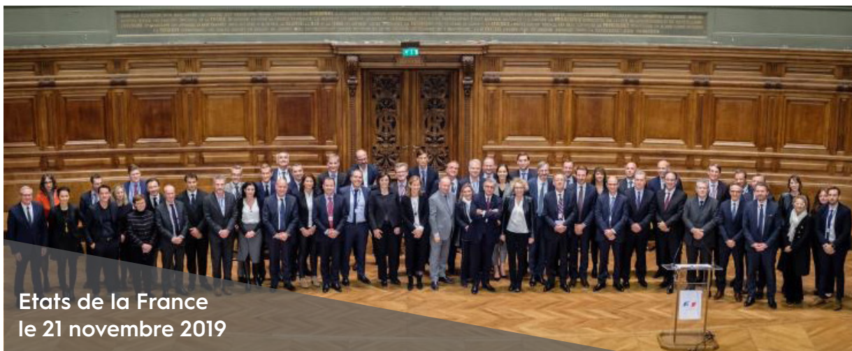
Etats de la France le 21 novembre 2019