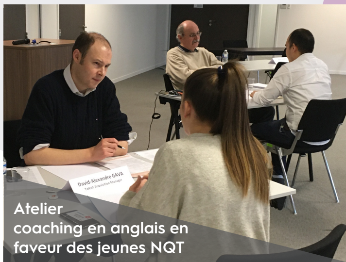
Atelier coaching en anglais en faveur des jeunes NQT

Directeur Talent Acquisition France-Belgium