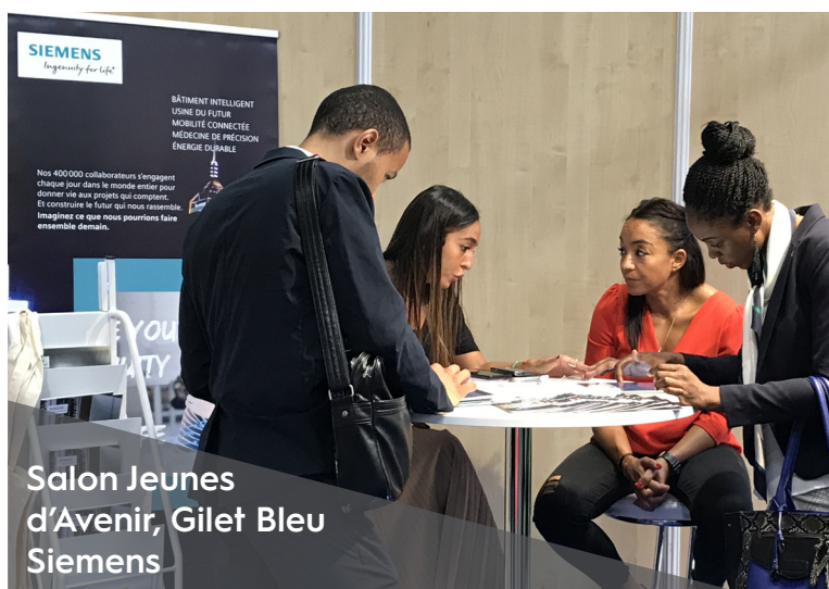
Salon Jeunes d'Avenir, Gilet Bleu Siemens