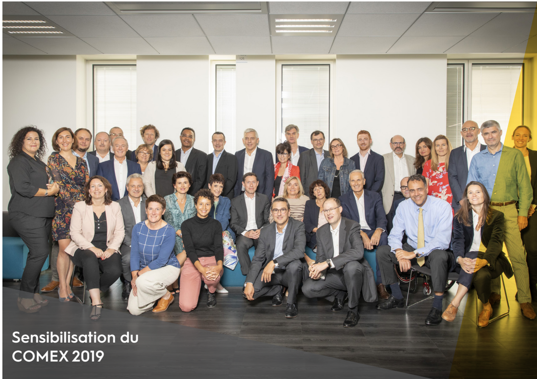
Sensibilisation du COMEX 2019