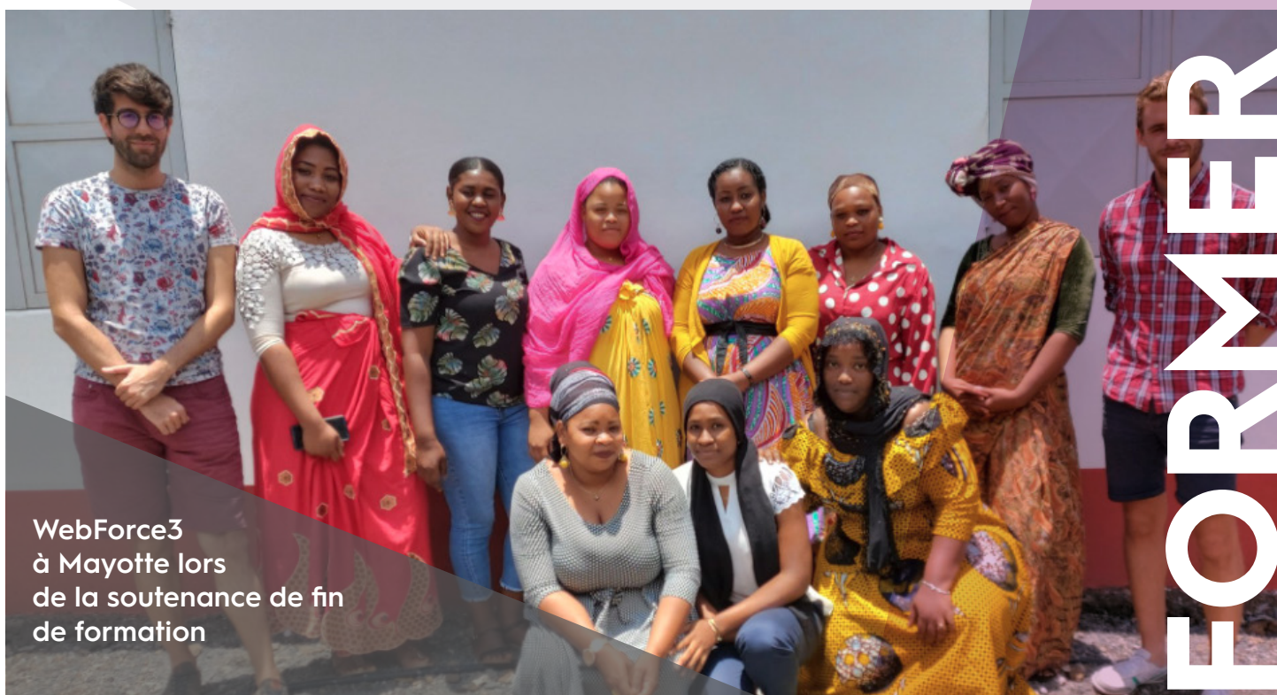
WebForce3 à Mayotte lors de la soutenance de fin de formation