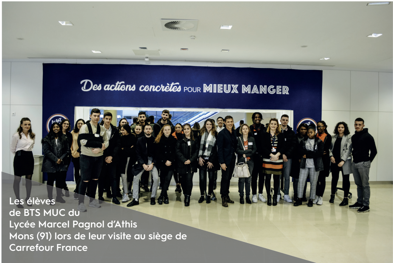
Les élèves de BTS MUC du Lycée Marcel Pagnol d'Athis Mons (91) lors de leur visite au siège de Carrefour France

Carrefour France, Coca-Cola European partners et l'association « Le Réseau » se sont unis autour d'un programme inédit : « Au Carrefour d'un parcours : l'histoire d'un Coca-Cola »