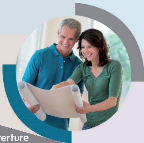
Couverture de la Charte des Achats Responsables Synergie