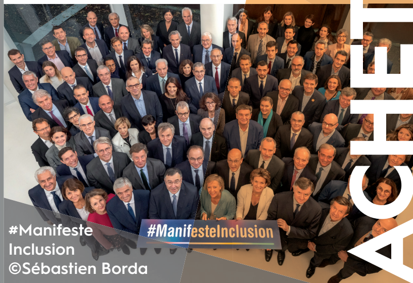
#Manifeste Inclusion