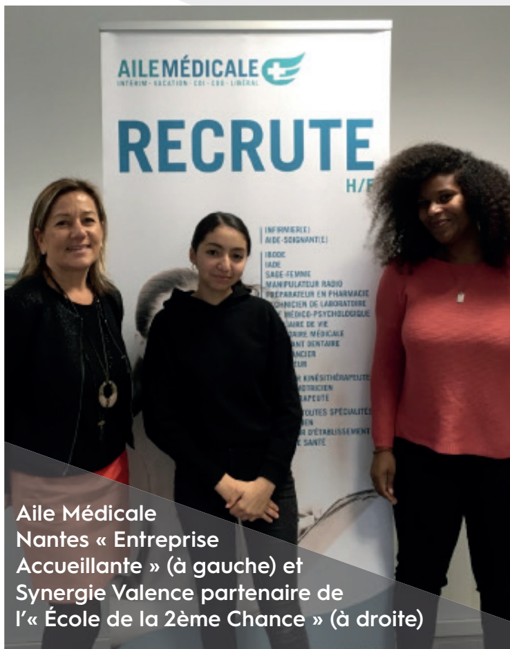
Aile Médicale Nantes « Entreprise Accueillante » (à gauche) et Synergie Valence partenaire de l'« École de la 2ème Chance » (à droite)

Responsable d'agence AILE MEDICALE Groupe Synergie