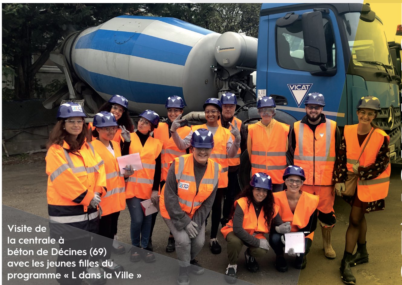
Visite de la centrale à béton de Décines (69) avec les jeunes filles du programme « L dans la Ville »

Présidente de l'association Tous en Stage