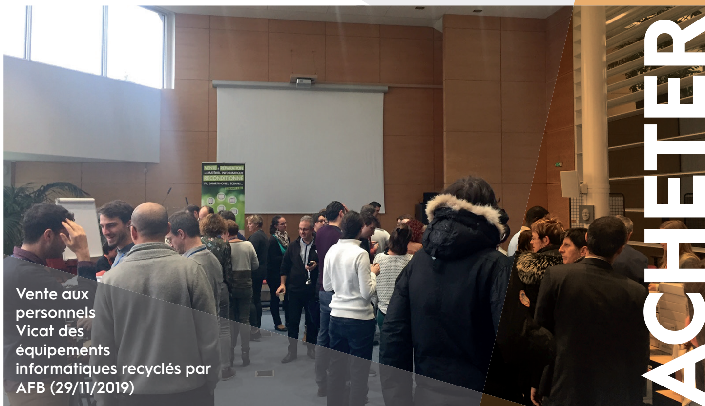
Vente aux personnels Vicat des équipements informatiques recyclés par AfB (29/11/2019)