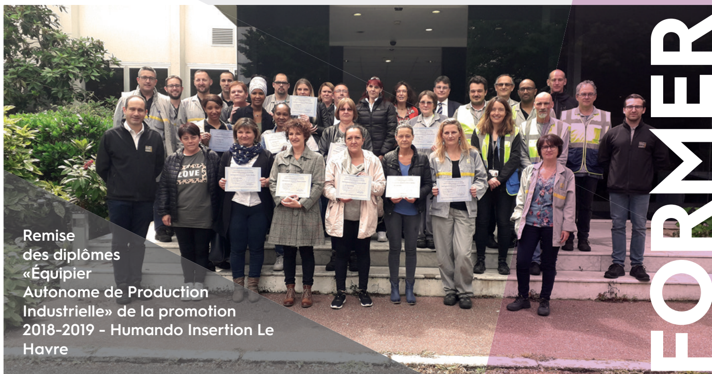
Remise des diplômes «Équipier Autonome de Production Industrielle» de la promotion 2018-2019 - Humando Insertion Le Havre