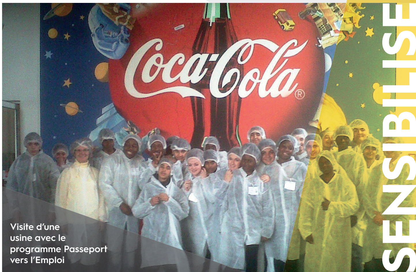
Visite d'une usine avec le programme Passeport vers l'Emploi

Assistante de Direction Usine Coca-Cola Europeans Partners France Clamart