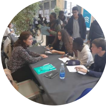
Forum des métiers organisé à Toulouse en Novembre 2018

« Depuis plusieurs années est organisé à Toulouse un forum des métiers dans le but de proposer des stages aux collégiens d'établissements REP et REP+. Lors de nos rencontres avec les jeunes, nous adaptons notre présentation d'entreprise afin qu'elle soit plus ludique et accessible, ce qui permet des échanges plus riches pour susciter l'intérêt et ouvrir les champs des possibles. L'objectif est que les jeunes puissent commencer à réfléchir à leur avenir professionnel et, qui sait, pourquoi pas intégrer le groupe Carrefour ! »