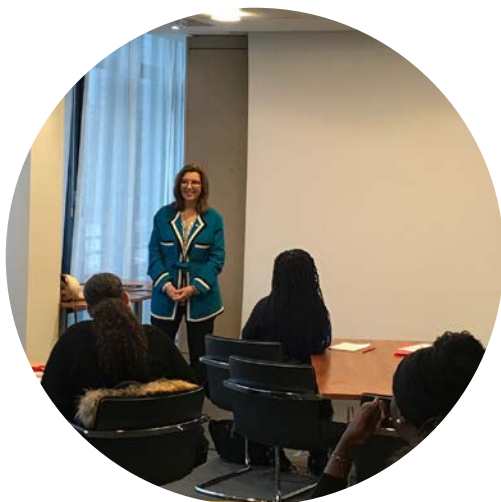
Rencontre des stagiaires de 3 e avec Sophie Bellon, Présidente du conseil d'administration de Sodexo.