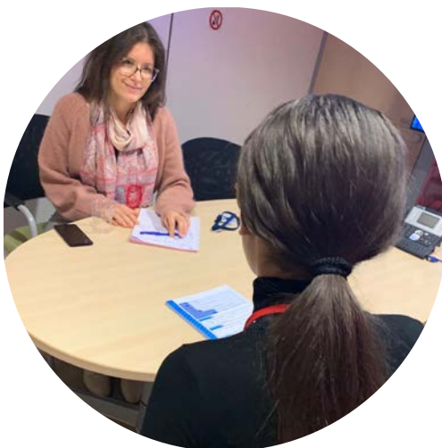
Les stagiaires de 3 e passent des entretiens avec les collaborateurs RH de Sodexo.