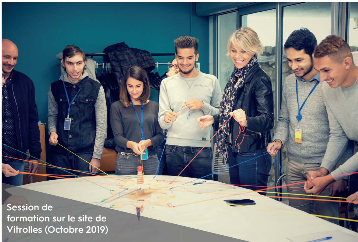
Session de formation sur le site de Vitrolles (Octobre 2019)

Le focus met en exergue une action à fort impact social déployée récemment par FDJ.