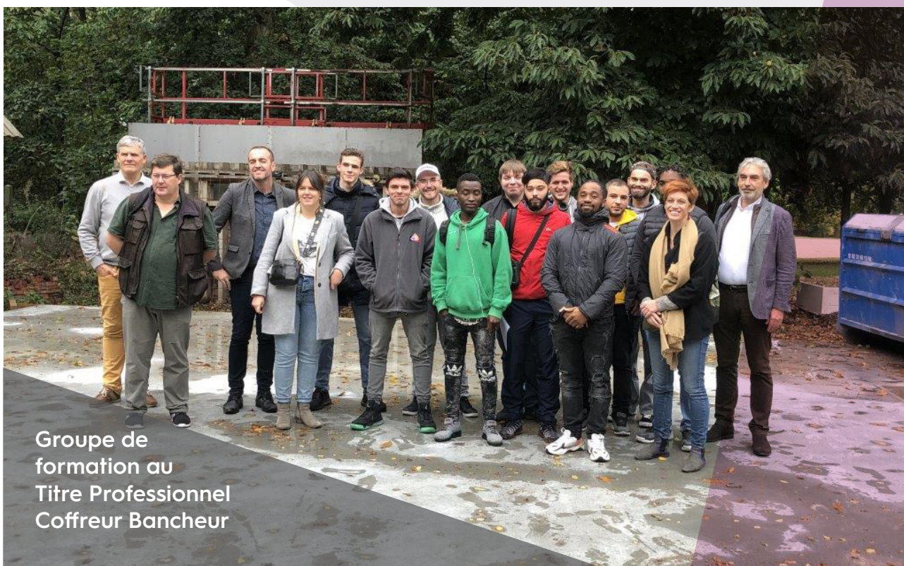
Groupe de formation au Titre Professionnel Coffreur Bancheur

Salarié intérimaire en contrat d'apprentissage, SOS INTERIM de Rouen