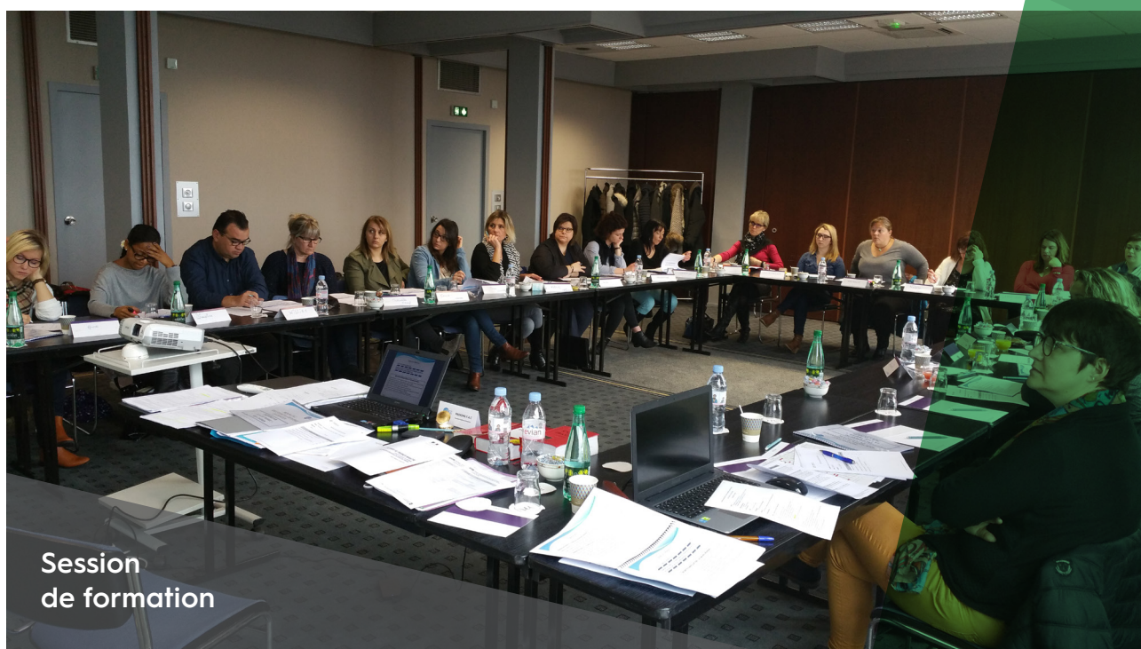
Session de formation

Assistante de l'agence SOS Intérim d'Évreux