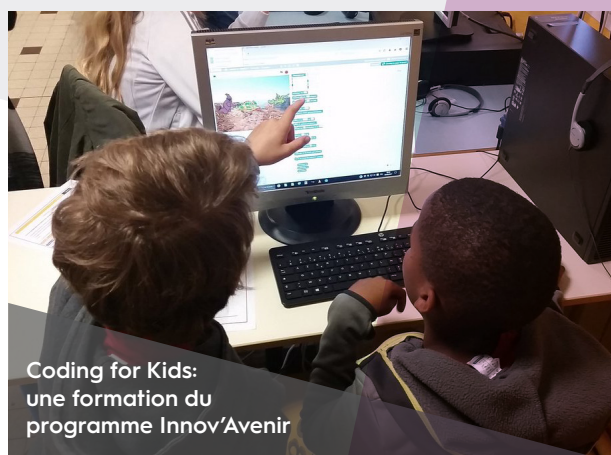
Coding for Kids: une formation du programme Innov'Avenir