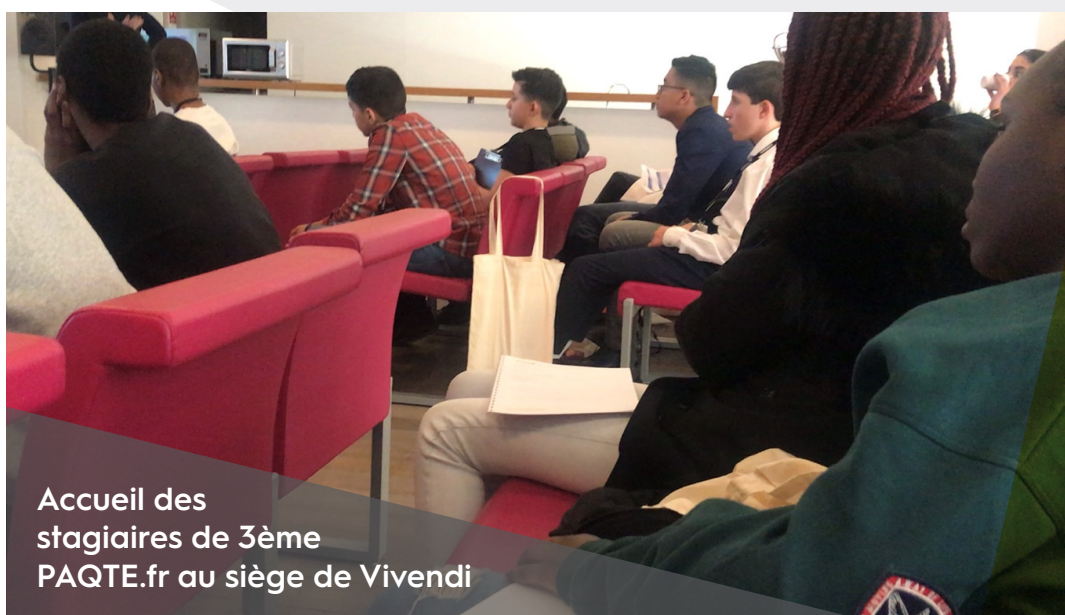
Accueil des stagiaires de 3ème PAQTE.fr au siège de Vivendi