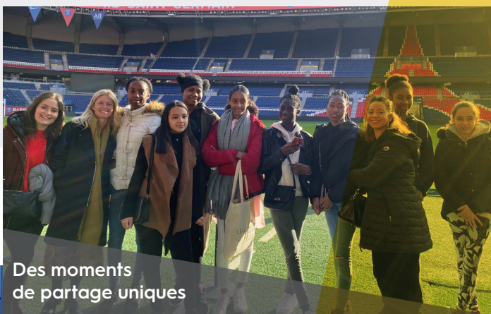
Des moments de partage uniques

Directrice de l'hôtel Ibis Paris Sacré Coeur