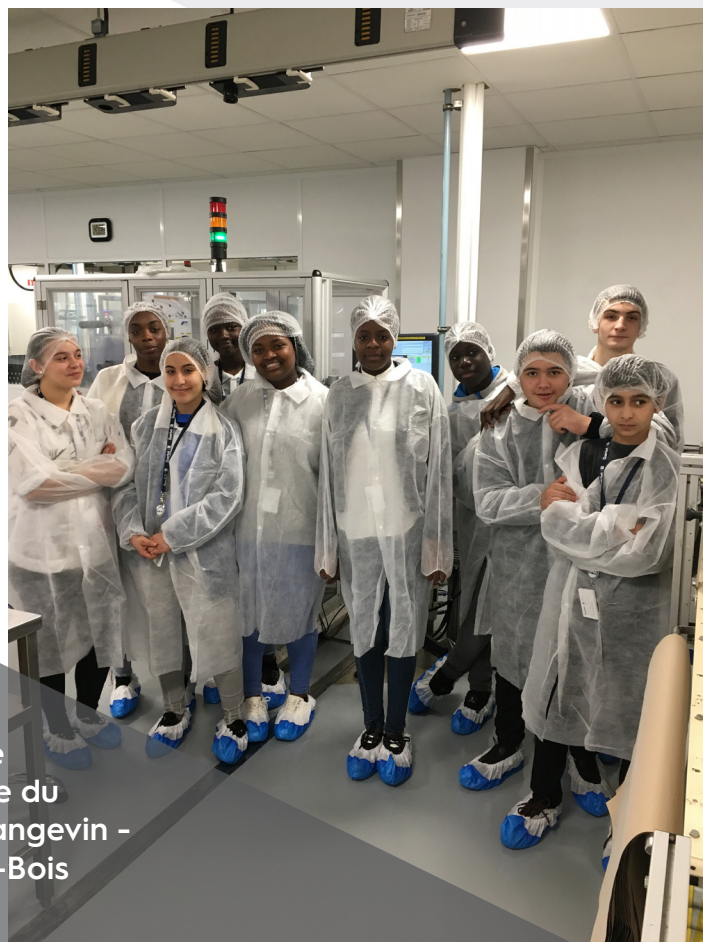
Visite des lignes de production de la classe de 3ème du collège Travail Langevin - Site Aulnay-sous-Bois

Directeur de l'établissement Guerbet d'Aulnay-sous-Bois