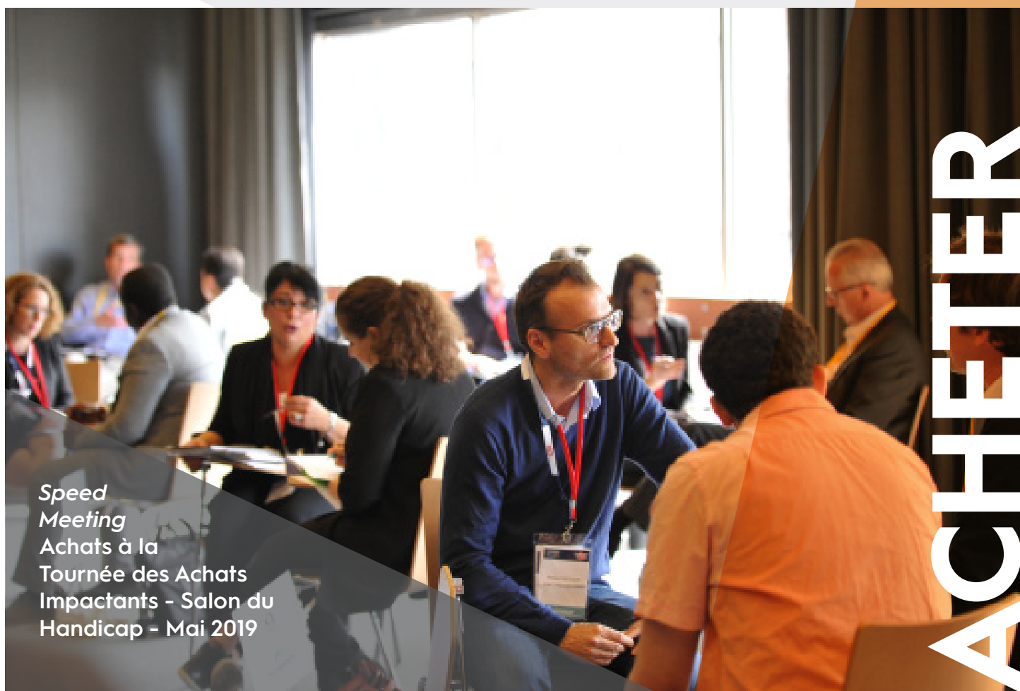
Speed Meeting Achats à la Tournée des Achats Impactants - Salon du Handicap - Mai 2019