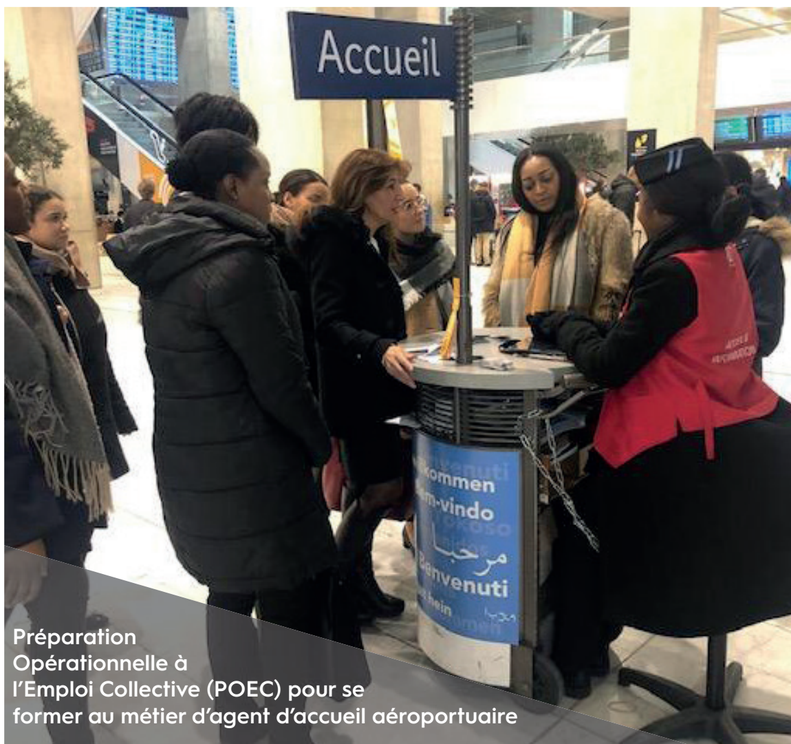
Préparation Opérationnelle à l'Emploi Collective (POEC) pour se former au métier d'agent d'accueil aéroportuaire

Dans une dynamique collaborative, Proactive Academy et ses partenaires, ont collaboré sur la mise en place de POEC (Préparation Opérationnelle à l'Emploi Collective) dite «proactive». Il s'agit d'actions innovantes de formations courtes et individualisées sur les besoins des entreprises. La formation s'adresse à des demandeurs d'emploi qui ont un projet professionnel autour des métiers en tension comme agent d'accueil aéroportuaire, community manager ou télévendeur.