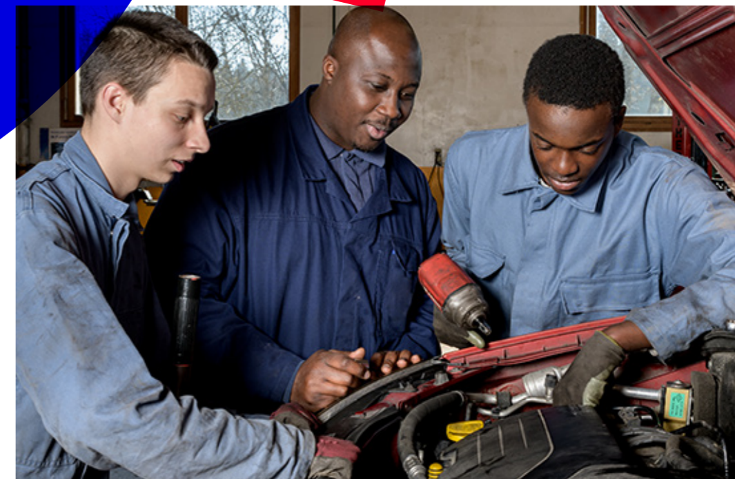
LES ÉCOLES DE PRODUCTION SOUTENUES PAR LA FONDATION RENAULT