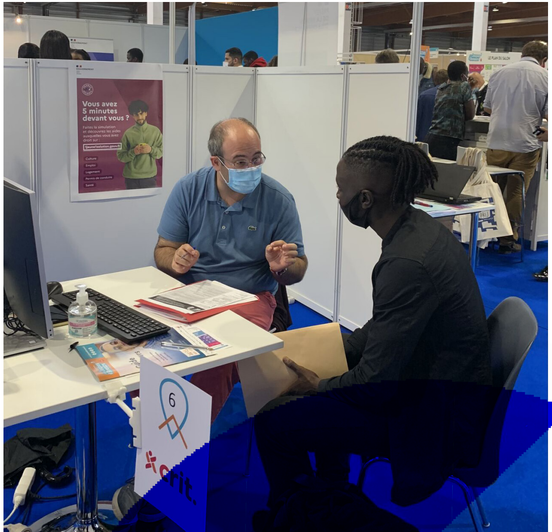
CRIT AU STAND COACHING IMPACT