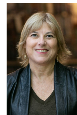
ISABELLE DELAPLACE DÉLÉGUÉE GÉNÉRALE DE LA FONDATION D'ENTREPRISE FDJ