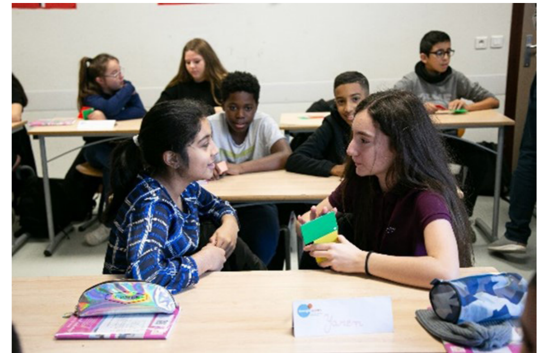
SÉANCE DE « MA RÉUSSITE AU COLLÈGE » ORGANISÉ PAR ENERGIE JEUNES À GOUSSAINVILLE